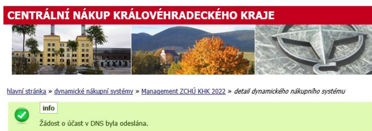
Obrázek 4: Informace o odeslání žádosti

Po úspěšném podepsání a odeslání se zobrazí informace o odeslání (obr.4), dále se odeslaná žádost o účast zobrazí na detailu DNS v bloku „Odeslané žádosti o účast v DNS“. Je zde uvedeno jméno uživatele, který žádost o účast odeslal, stav a datum jejího doručení. Nyní běží zákonná lhůta, ve které musí zadavatel vaši žádost o účast otevřít a posoudit.