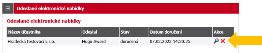
Obrázek 11: Přehled odeslaných elektronických nabídek, zneplatnění

Již odeslanou (resp. doručenou elektronickou nabídku) lze ve lhůtě pro podání nabídek zneplatnit a získat tak možnost odeslat novou nabídku ve stanovené lhůtě. Zadavateli tak nebude obsah takovéto zneplatněné elektronické nabídky dostupný. Zneplatnění se provádí pomocí ikony „červeného křížku“, viz obrázek 11.