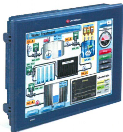
OPLC Vision 1210