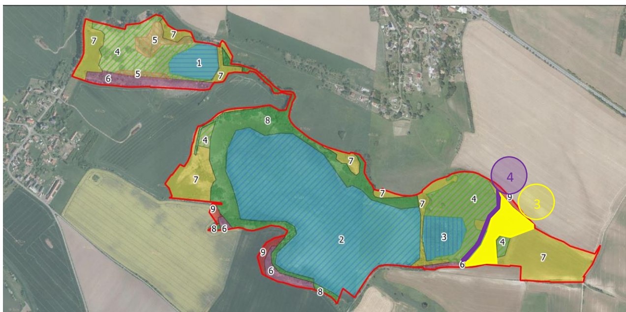
Obr. 2 Schematické znázornění zájmové plochy určené ke kosení travních porostů (zvýrazněno žlutě) a plochy určené ke kosení pruhu v zimě pokosených rákosin (zvýrazněno