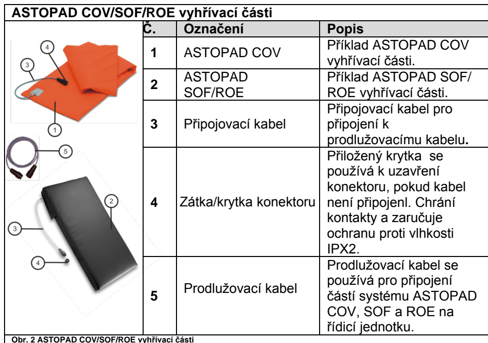
Obr. 2 ASTOPAD COV/SOF/ROE vyhřívací části