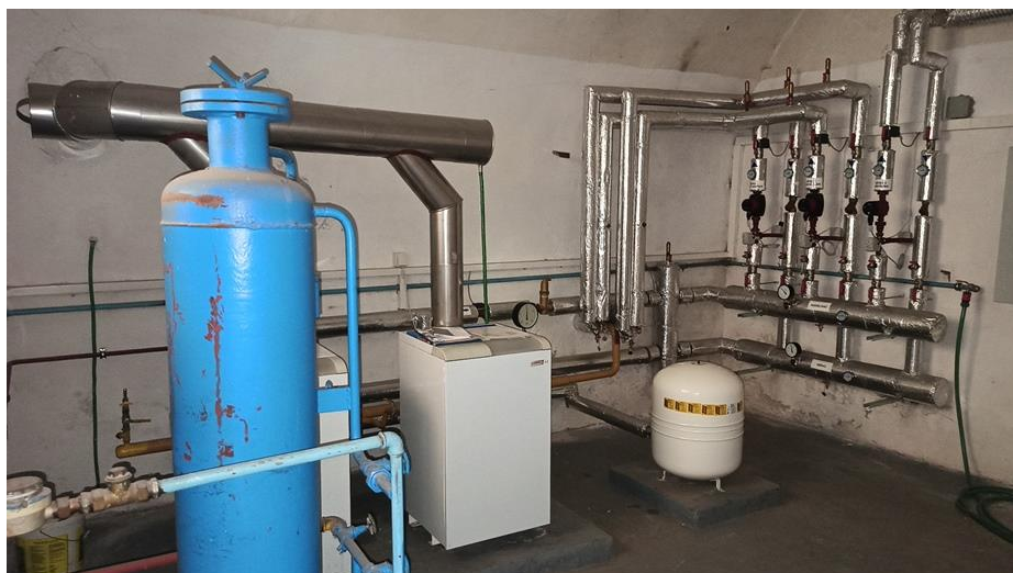
3.9 místnost 1.09 – dvůr