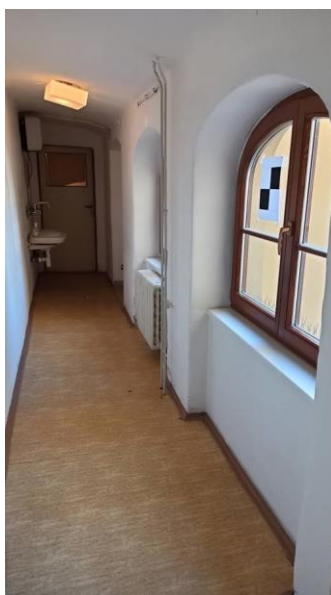
3.20 místnost 1.20 – WC