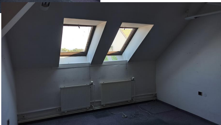
6.07 místnost 4.07 – kancelář