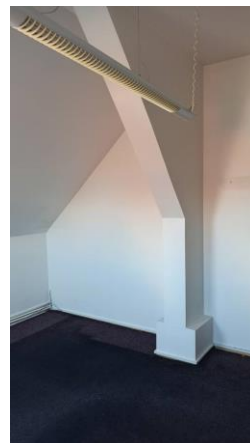
6.08 místnost 4.08 – 4.12 – chodba, WC