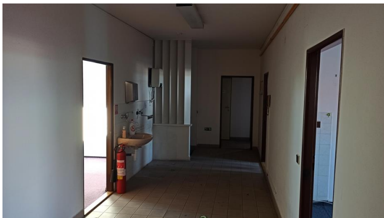
6.01 místnost 4.01 – chodba