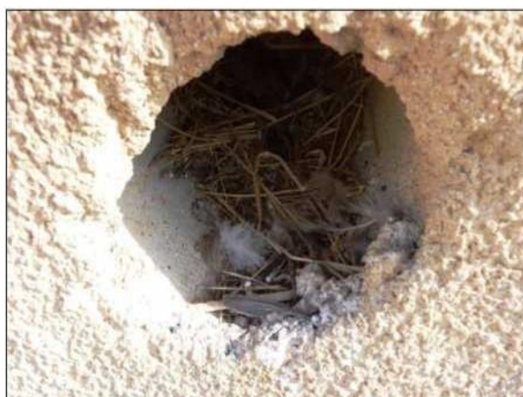
Hnízdní materiál, vypadávající z hnízda vrbců