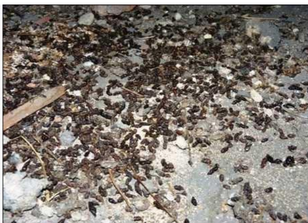
Trus netopýřů se často hromadí na podlaze půdy, na okenních a balkónových parapetech i v dutinách nebo větracích kanálcích plochých jedno a dvouplášťových střech