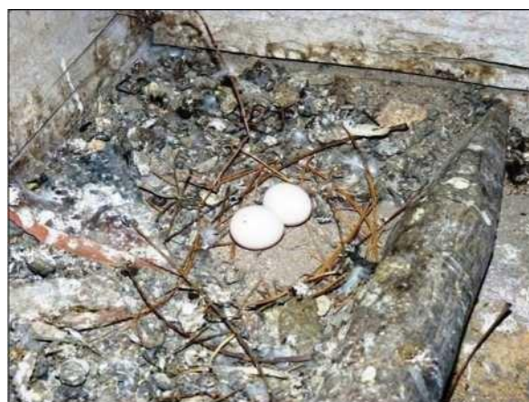
Hnízdo holuba věžáka je většinou nedokončené