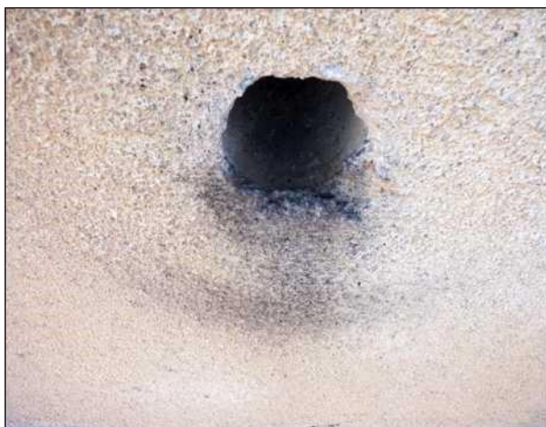
Znečištění fasády pod ventilačním otvorem způsobené otěrem rýdovacích per pěvců