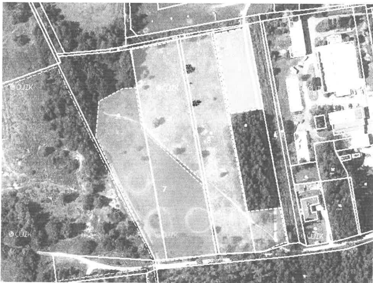
Obr. 3 Schematické znázornění plochy se skupinou bříz, vrb a střemchy s podrostem třtiny křovištní určené k vyřezání dřevin a následného pokosení