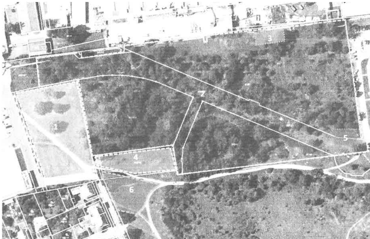
Obr. 2 Schematické znázornění ploch určených ke kosení a výřezu dřevin