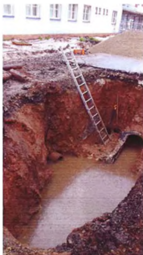
Otevřený výkop na poruše kanalizačního sběrače