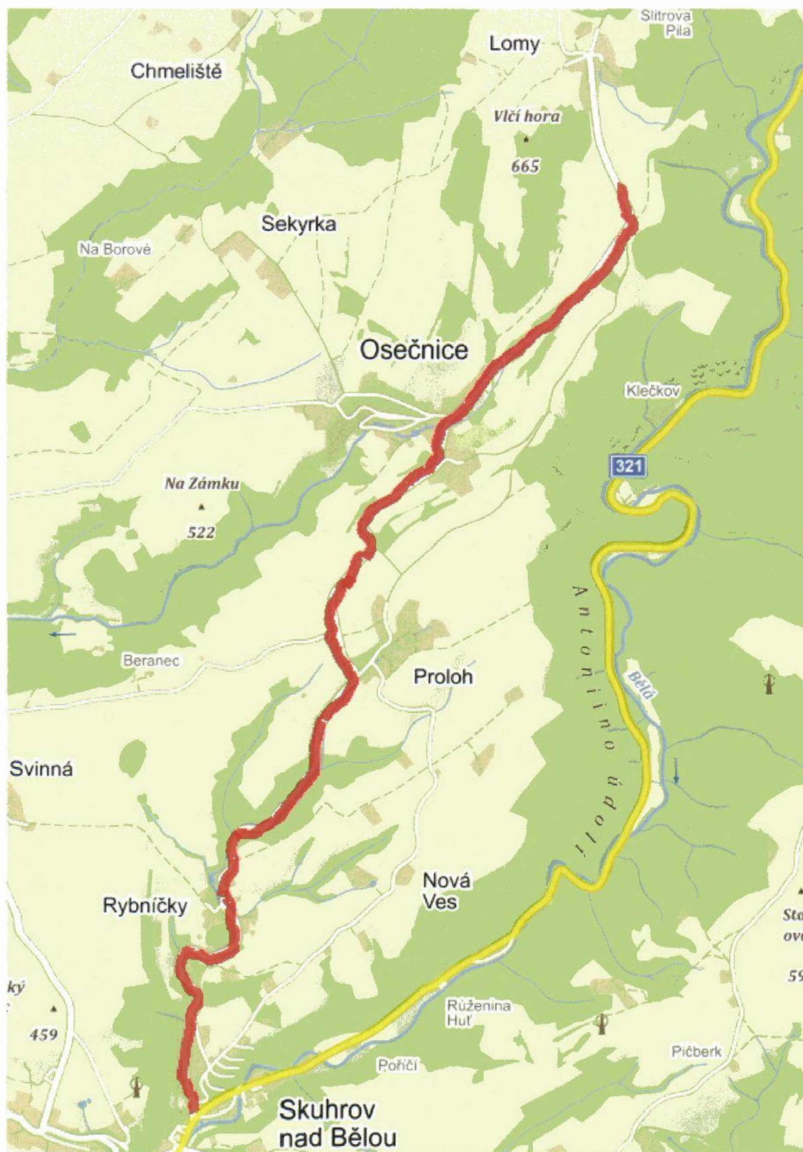
MAPA CELKOVÉ SITUACE