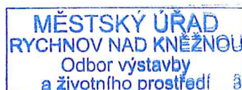
Ing. Petra Ponková referent odboru

Správní poplatek podle zákona č. 634/2004 Sb., o správních poplatcích, ve znění pozdějších předpisů, stanovený podle položky 18 odst. 3 ve výši 1000,- Kč, sazebníku správních poplatků v celkové hodnotě 1000,- Kč byl uhrazen dne 26.04.2022.