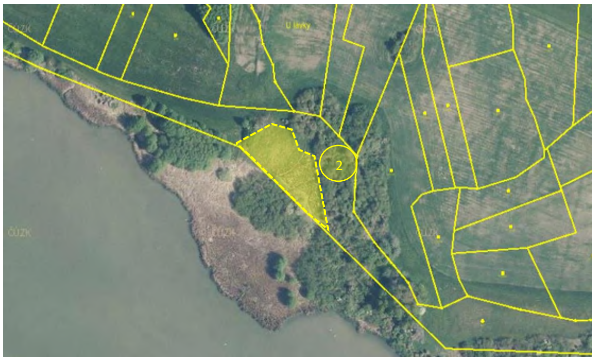
Obr. 4 Schematické znázornění zájmové plochy určené ke kosení travních porostů včetně odstranění výmladků dřevin a vyhrabání stařiny (žlutě) a plochy určené ke kosení rákosin (fialově), jedná se o části pozemků p. č. 927 a 857 v k. ú. Ostružno u Jičína a pozemků p. č. 70/4, 70/5, 70/7, 70/8 a 70/10 v k. ú. Ohaveč