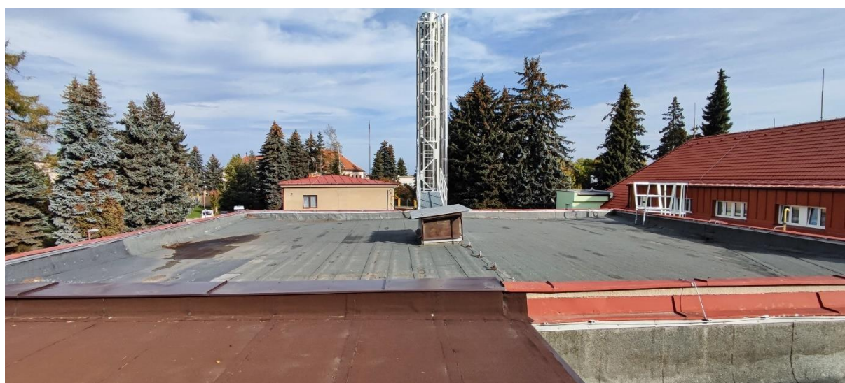
Obr. č. 7 Nemocnice Nový Bydžov, Oblastní nemocnice Jičín a.s. – střecha H

FVE představuje přídavné zatížení přibližně 35 kg/m 2 . Vychází se z předpokladu, že střechy jsou ve vyhovujícím stavu a že dodatečné zatížení vyvolané instalací FVE snesou. Místním šetřením se střechy jeví jako vyhovující pro umístění FVE pomocí konstrukce PB III.