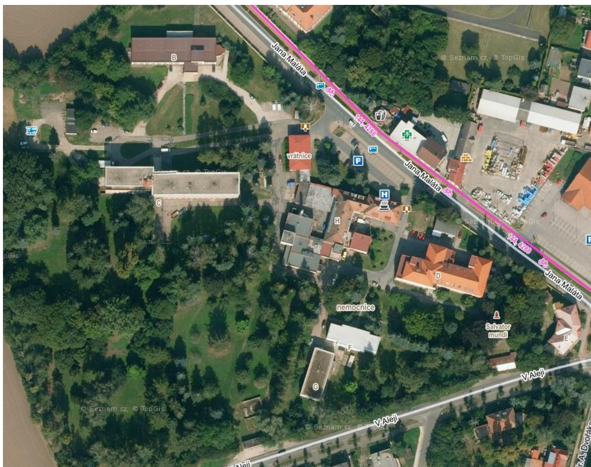
Obr. č. 1 Nemocnice Nový Bydžov, Oblastní nemocnice Jičín a.s.

Objekty jsou svým charakterem určeny pro poskytování akutní lůžkové péče (v oboru interním, chirurgickém a urologickém), následné péče, stravování.