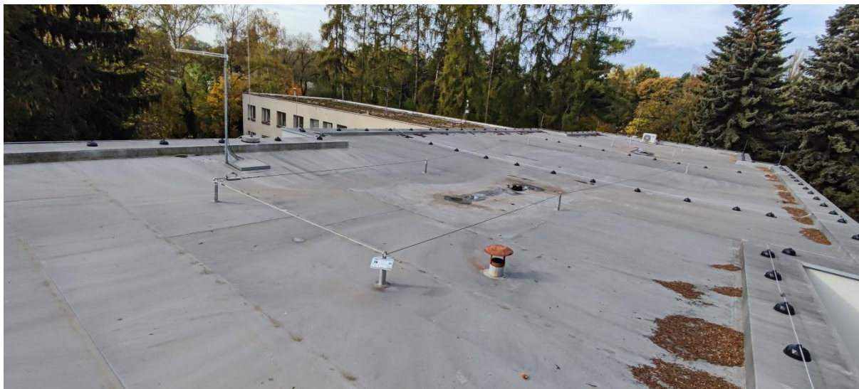
Obr. č. 6 Nemocnice Nový Bydžov, Oblastní nemocnice Jičín a.s. – střecha F