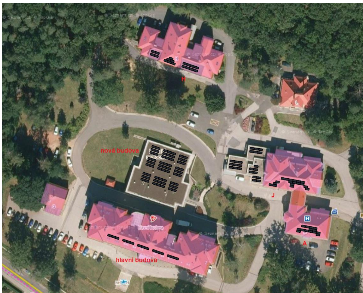
Obr. č. 3 Předpokládané rozmístění panelů na střechách