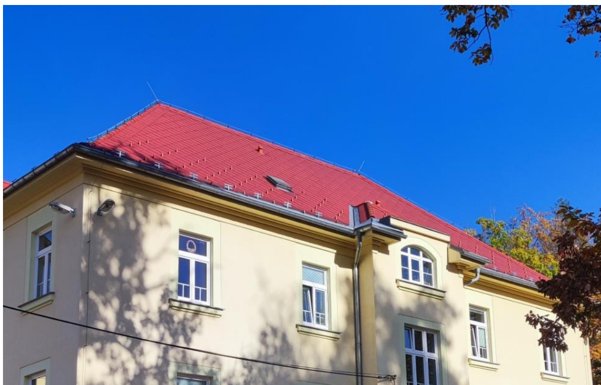
Obr. č. 5 Městská nemocnice a. s., Dvůr Králové nad Labem – střecha A

FVE představuje přídavné zatížení přibližně 15 kg/m 2 . Vychází se z předpokladu, že střechy jsou ve vyhovujícím stavu a že dodatečné zatížení vyvolané instalací FVE snesou. Místním šetřením se střechy jeví jako vyhovující pro umístění FVE s přímým kotvením střešní konstrukce pomocí určených systémových úchytů.