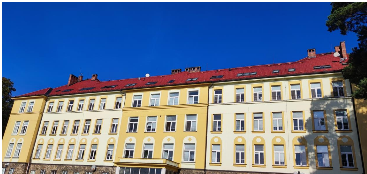
Obr. č. 6 Městská nemocnice a. s., Dvůr Králové nad Labem – střecha hlavní budova