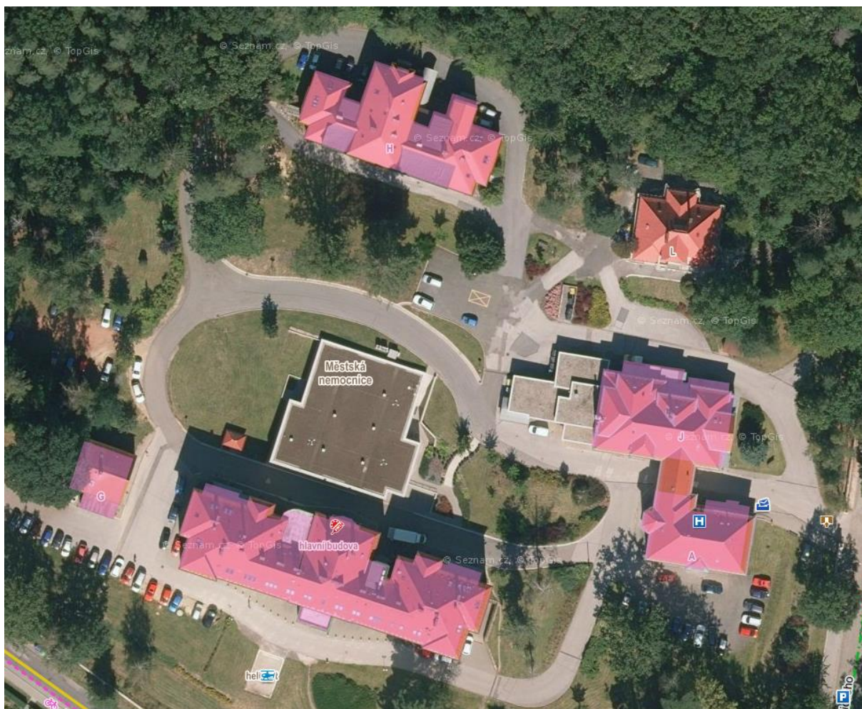
Obr. č. 1 Městská nemocnice a. s., Dvůr Králové nad Labem

Objekty jsou svým charakterem určeny pro poskytování akutní lůžkové péče (v oboru interním, chirurgickém a urologickém), následné péče, stravování.