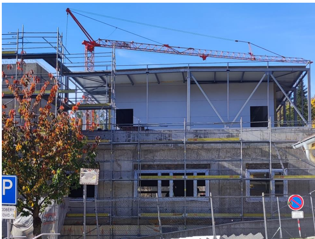
Obr. č. 8 Městská nemocnice a. s., Dvůr Králové nad Labem – střecha operačních sálů nová budova

FVE představuje přídatné zatížení přibližně 35 kg/m 2 . Vychází se z předpokladu, že střechy jsou ve vyhovujícím stavu a že dodatečné zatížení vyvolané instalací FVE snesou. Místním šetřením se střechy jeví jako vyhovující pro umístění FVE s přitěžovanou konstrukcí bez zásahu do střešní krytin.