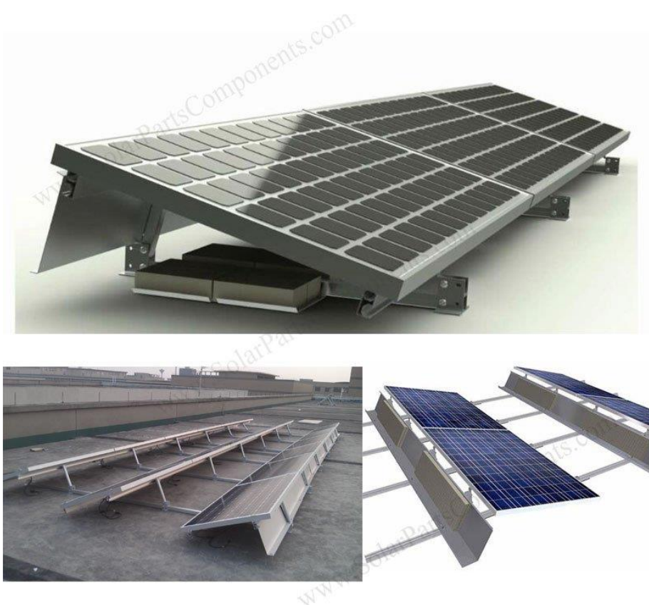
Obr. č. 11 Umístění panelů na roznášecí konstrukci pro plochou střechu