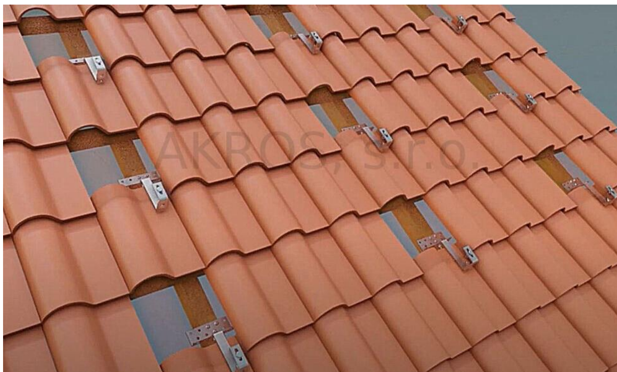
Obr. č. 9 vyobrazení navrženého uchycení roznášecí konstrukce na objektech hlavní budovy, A, H a J

Pro instalaci fotovoltaických panelů na šikmé střeše je možné jako nejvhodnější použít roznášecí konstrukci. Pro instalaci na rovné střeše je jako nejvhodnější použít přitěžovanou konstrukci. Konstrukce jsou vyobrazeny na následujících obrázcích.