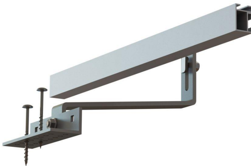
Obr. č. 10 Možné uchycení držáků roznášecí konstrukce do trámů na objektech hlavní budovy, A, H a J pro eternitovou krytinu