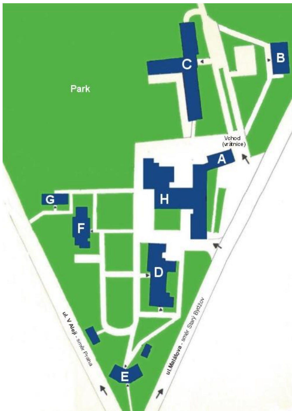
Obr. č. 2 Nemocnice Nový Bydžov, Oblastní nemocnice Jičín a.s.