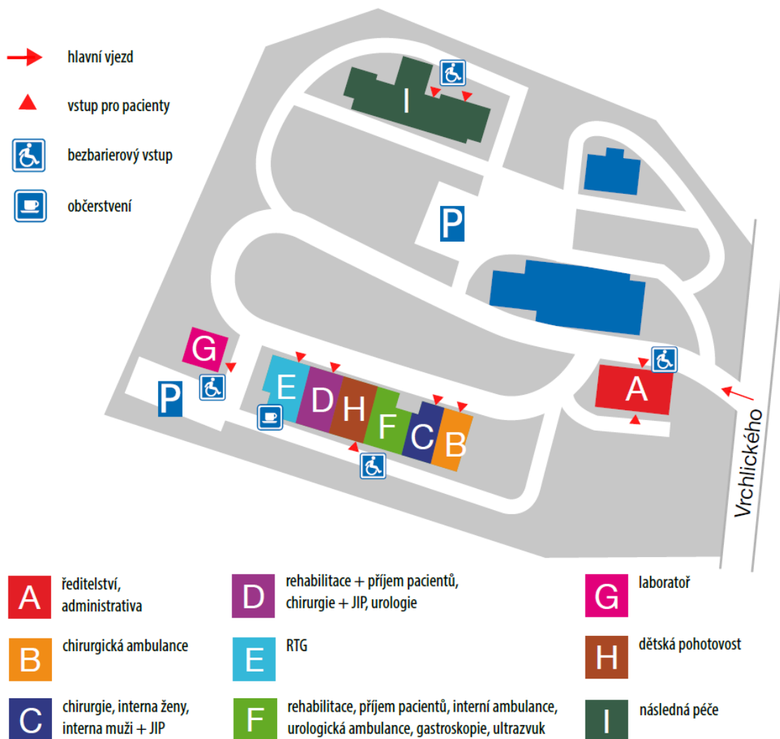
Obr. č. 2 Městská nemocnice a. s., Dvůr Králové nad Labem