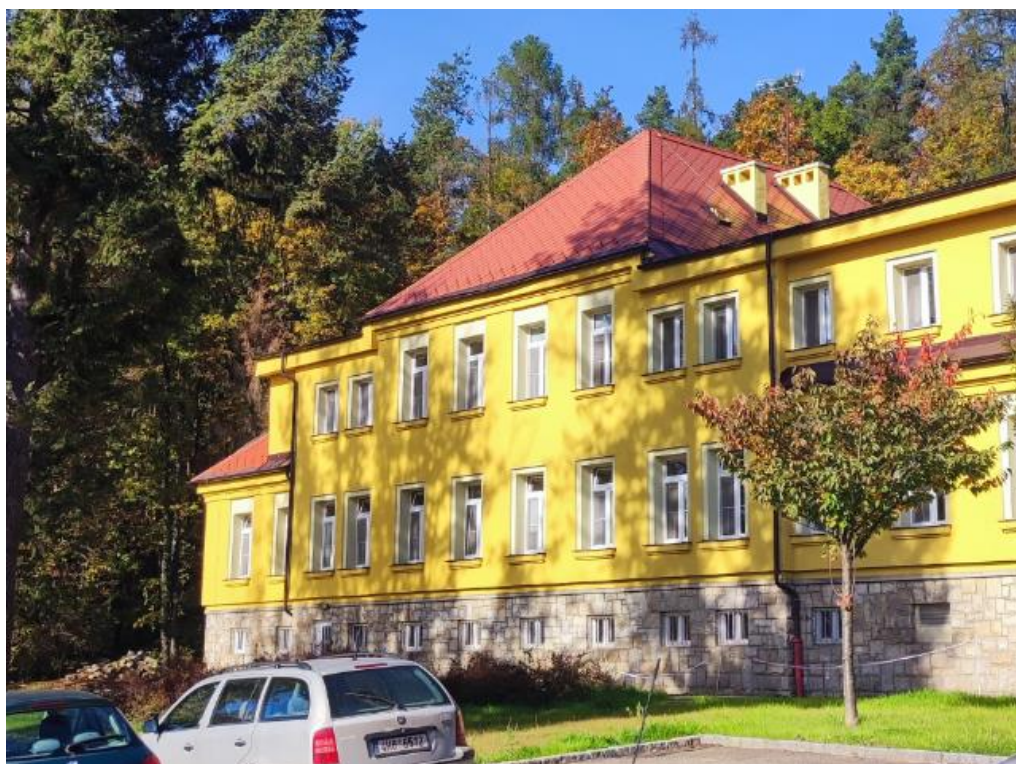
Obr. č. 7 Městská nemocnice a. s., Dvůr Králové nad Labem – střecha H