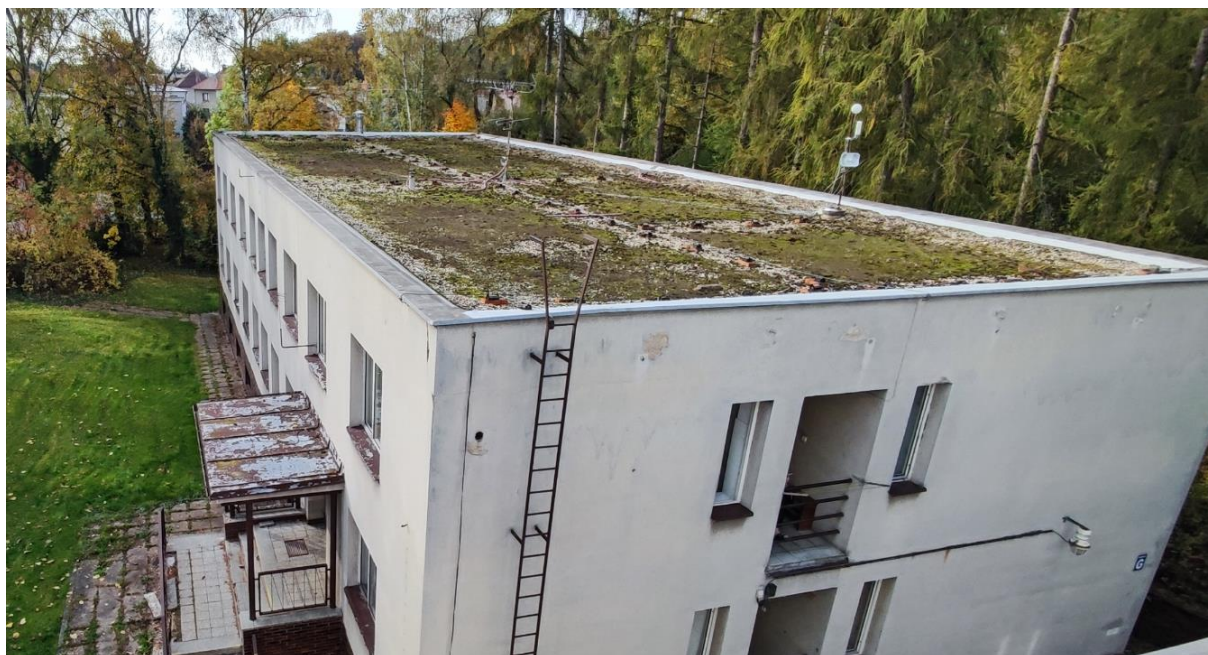
Obr. č. 8 Nemocnice Nový Bydžov, Oblastní nemocnice Jičín a.s. – střecha G

FVE představuje přídavné zatížení přibližně 35 kg/m 2 . Vychází se z předpokladu, že střechy jsou ve vyhovujícím stavu a že dodatečné zatížení vyvolané instalací FVE snesou. Místním šetřením se střechy jeví jako vyhovující pro umístění FVE pomocí konstrukce PB III.