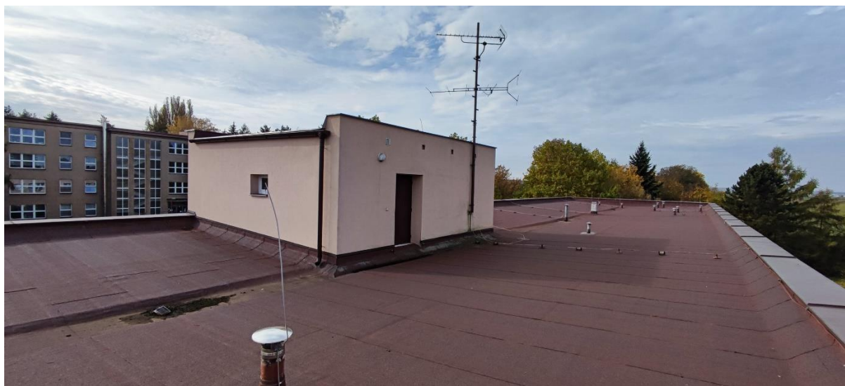
Obr. č. 5 Nemocnice Nový Bydžov, Oblastní nemocnice Jičín a.s. – střecha B

FVE představuje přídatné zatížení přibližně 35 kg/m 2 . Vychází se z předpokladu, že střechy jsou ve vyhovujícím stavu a že dodatečné zatížení vyvolané instalací FVE snesou. Místním šetřením se střechy jeví jako vyhovující pro umístění FVE pomocí konstrukce PB III.