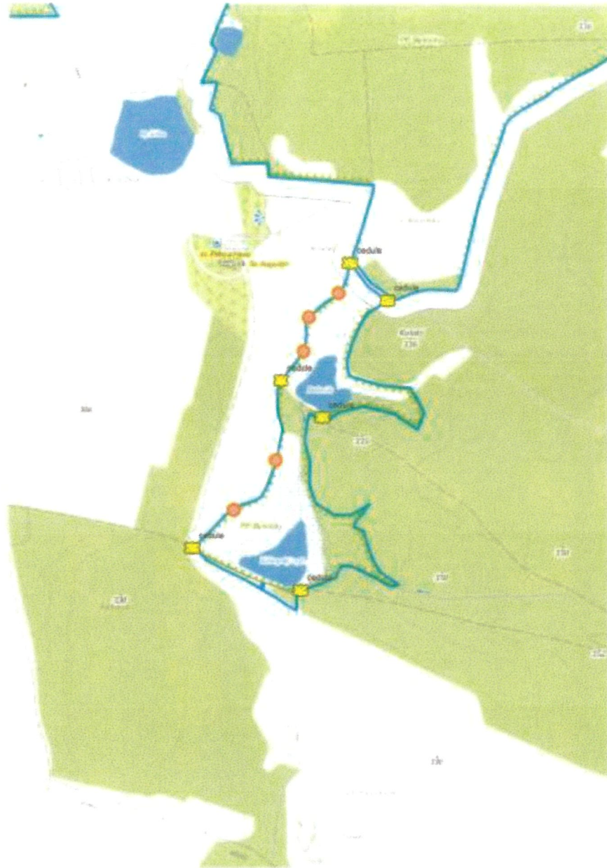
Schématické znázornění umístění sloupků s tabulí s malým státním znakem a samostatných sloupků s pruhovým značením v PP Byšičky 1