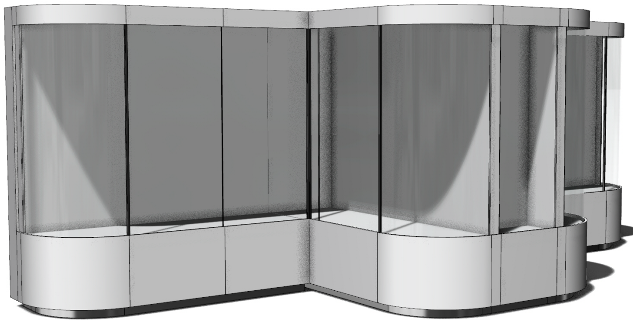
ilustrační vizualizace systému vitryn