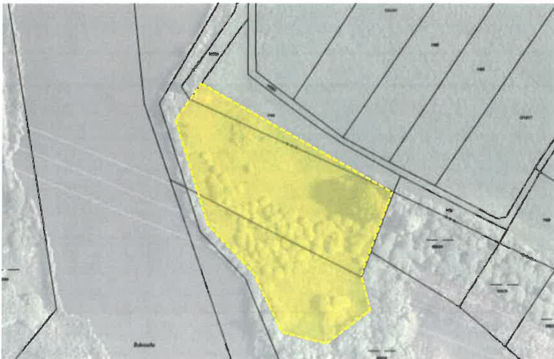
Obr. 1 Schematické znázornění plochy určené ke kosení (žlutě)