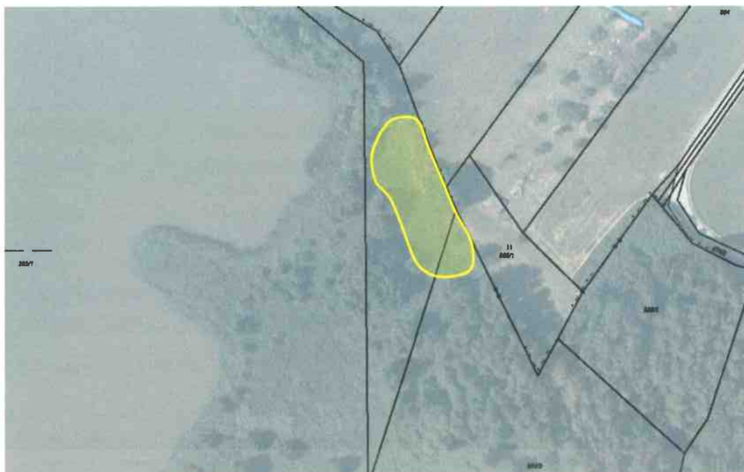
Obr. 2 Schematické znázornění plochy č. 2 určené ke kosení (žlutě) – podrobná specifikace barevně