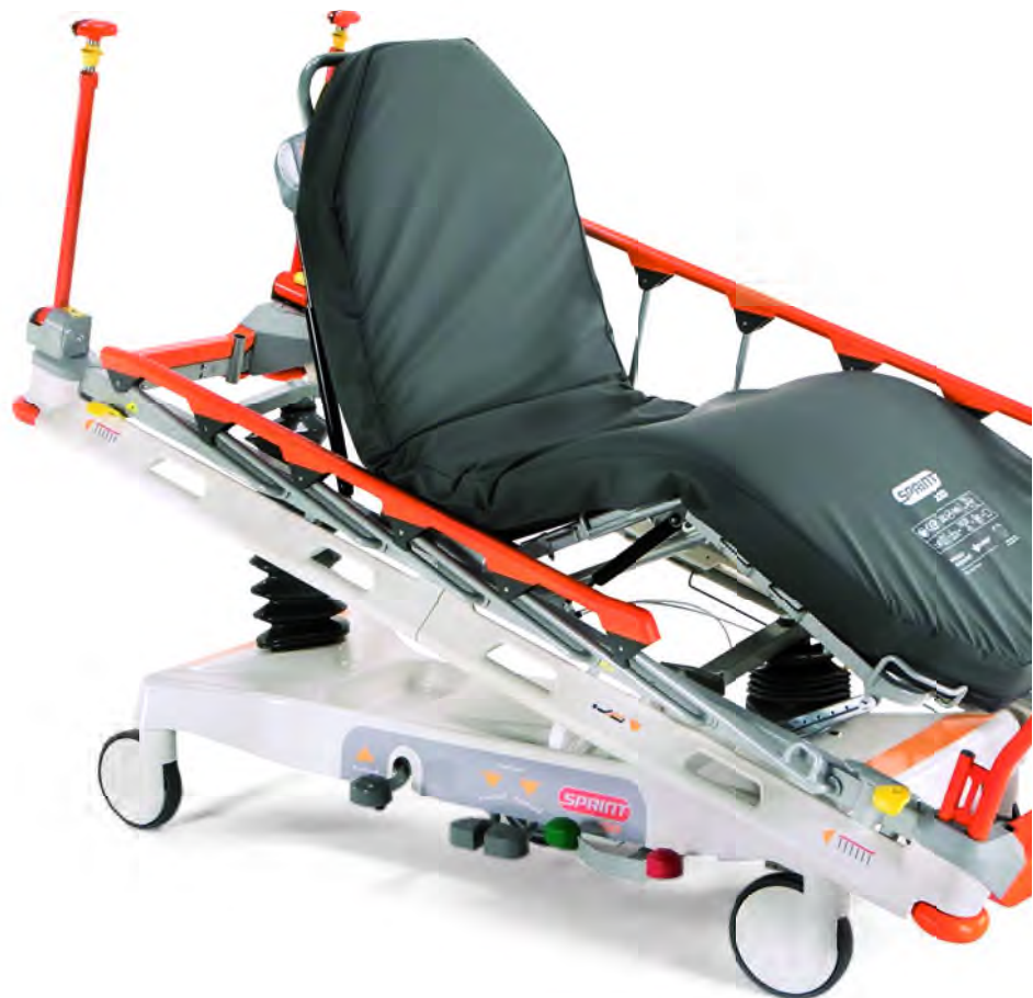
Sprint 100 Standard – výška 8 cm

Matrace mají svařované a šité spoje pro snazší hygienu.