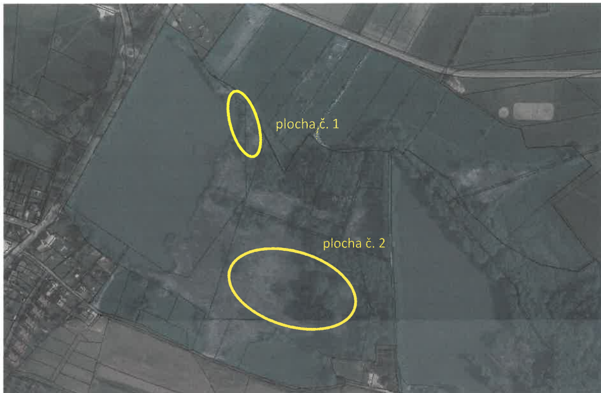
Obr. Schematické znázornění ploch určených ke kosení

Na ploše č. 1 bude kosená plocha rozšířena i do prostoru rákosiny, kde se vyskytují bultovité ostřice. Tyto bulty mohou být buď obsekány kolem (odstranění rákosu) nebo šetrně posekány tak, aby nebyla poškozena „stolička“ ostřice, tj. pokosit jen listy. Ruční kosení bude provedeno šetrně s ohledem na bultovité ostřice. Biomasa bude důsledně vyhrabána a odvezena z území přírodní památky Roudnička a Datlík. Kosení bude provedeno v termínu od 15. 08. 2020 do 30. 09. 2020.