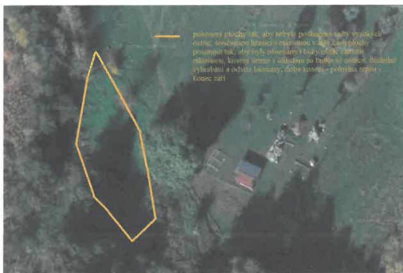
Obr. Kosení plochy č. 1 (detail)

Na ploše č. 1 bude kosená plocha rozšířena i do prostoru rákosiny, kde se vyskytují bultovité ostřice. Tyto bulty mohou být buď obsekány kolem (odstranění rákosu) nebo šetrně posekány tak, aby nebyla poškozena „stolička“ ostřice, tj. pokosit jen listy. Ruční kosení bude provedeno šetrně s ohledem na bultovité ostřice. Biomasa bude důsledně vyhrabána a odvezena z území přírodní památky Roudnička a Datlík. Kosení bude provedeno v termínu od 15. 08. 2020 do 30. 09. 2020.