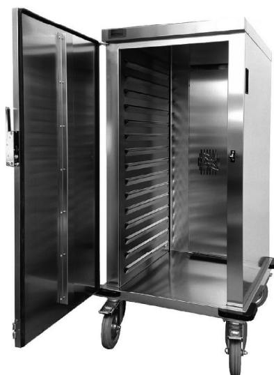
91618 ETV-T 1x15 GN 2/1