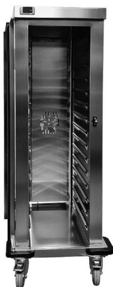
91078 ETV-T 1x15 GN 1/1