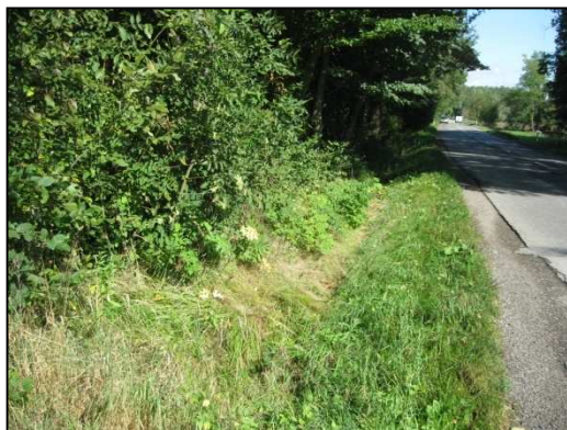
Obr. č. 16. Úsek silnice nad obcí – okraj lesa