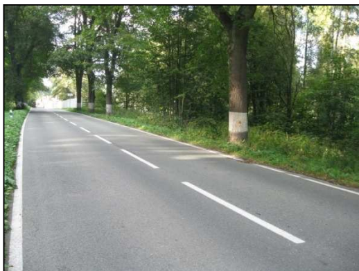
Obr.č.45. Úsek navazující na intravilán Police