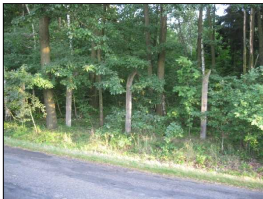
Obr. Č.62. Střední část řešeného úseku silnice