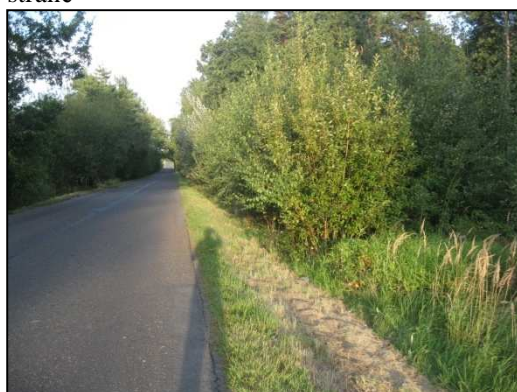
Obr.č.60. Střední část řešeného úseku silnice