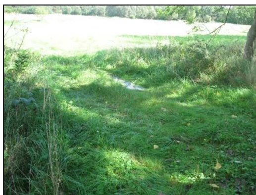
Obr.č.20. Sjezd ze silnice ve střední části