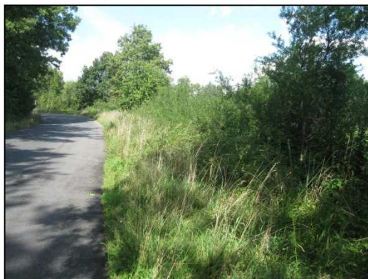
Obr. č. 24. Konec úseku na východní straně