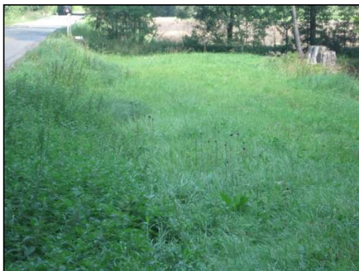
Obr.č.13. Prostor mezi silnicí a malou vodní nádrží