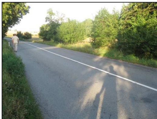
Obr. č. 56. Konec úseku na jižní straně