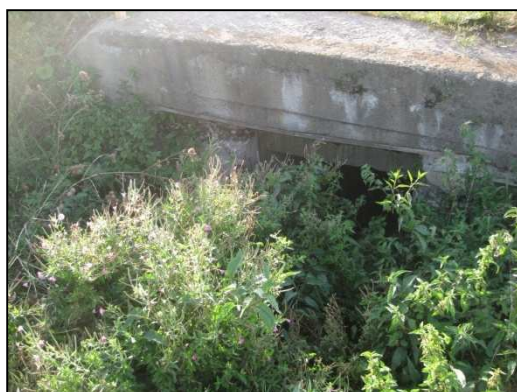
Obr.č.52. Křížení silnice s bezejmennou vodotečí – silniční most