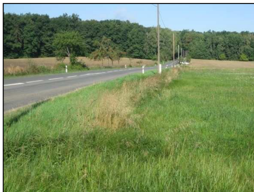
Obr. č.6. Úsek silnice navazující na Staré Nechanice