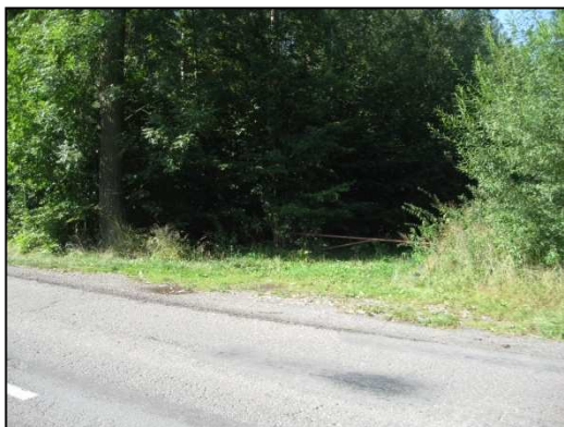
Obr.č.15. Úsek silnice nad obcí – sjezd do lesa