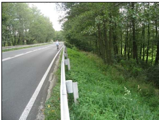
Obr.č.37. Silnice v koruně hráze rybníka Čermák