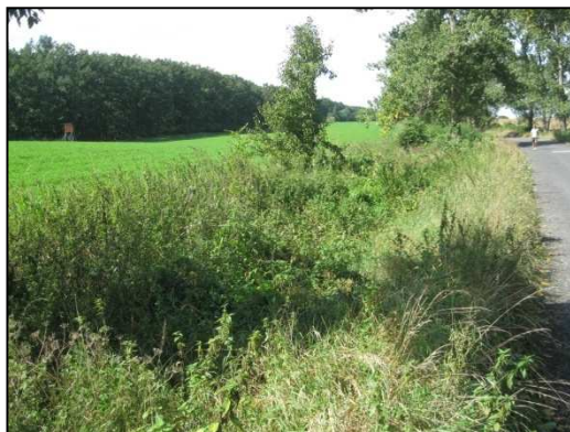
Obr.č.18. Začátek úseku na západní straně