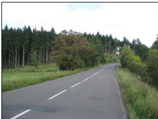
Obr.č.25. Pohled směrem na východní konec úseku řešené silnice