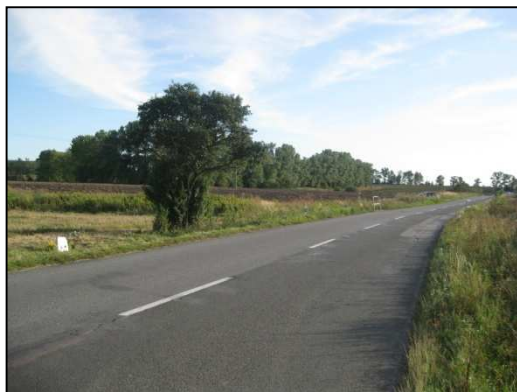
Obr.č.50. Začátek úseku na severní straně