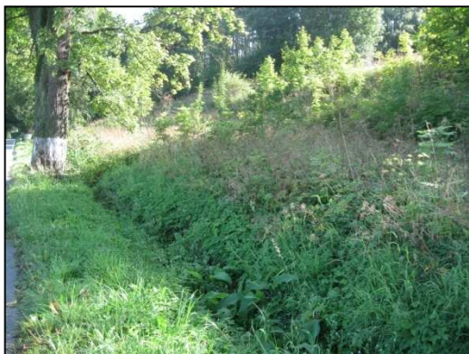
Obr.č.41. Začátek úseku na severní straně