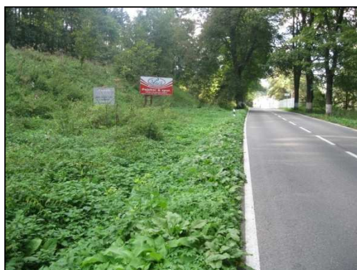
Obr.č.44. Úsek navazující na intravilán Police