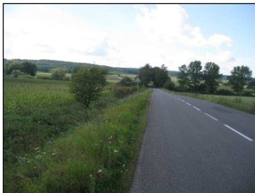
Obr.č.26. Střední část úseku řešené silnice