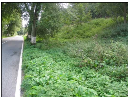
Obr.č. 43. Úsek navazující na intravilán Police