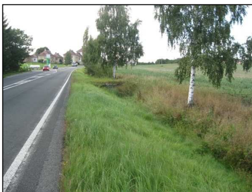
Obr.č. 35. Západní strana úseku