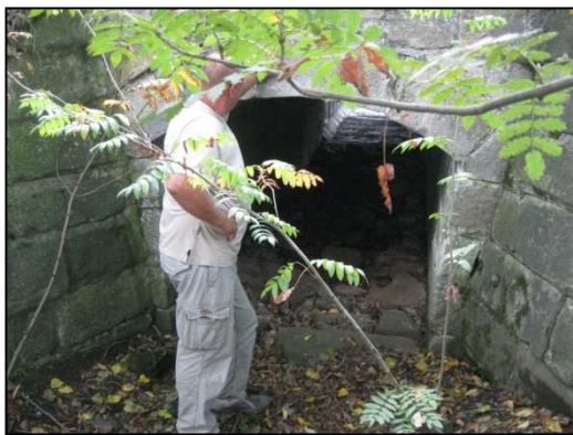
Obr.č.39. Most pod silnicí