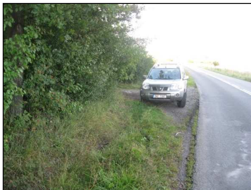
Obr. Č.54. Sjezd ze silnice v jižní části řešeného úseku silnice