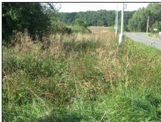
Obr. č. 8. Úsek silnice v intravilánu Starých Nechanic