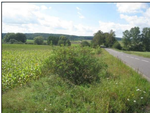
Obr.č.29. Střední úsek řešené silnice