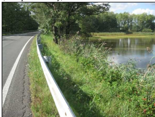
Obr. Č.38. Silnice v koruně hráze rybníka Čermák