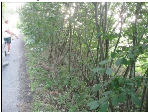
Obr.č.61. Vegetace podél komunikace ve střední části řešeného úseku silnice