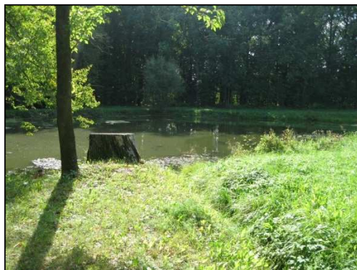
Obr.č.12. Prostor mezi silnicí a malou vodní nádrží