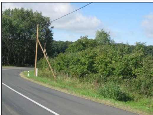
Obr.č.7. Úsek silnice v intravilánu Starých Nechanic