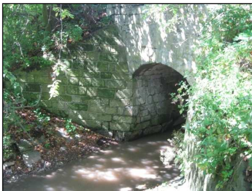
Obr.č.31. Most – křížení vodního toku Bubnovka se silnicí