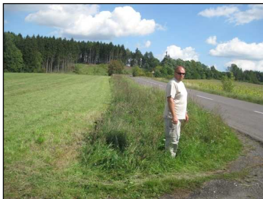
Obr. Č.30. Střední úsek řešené silnice