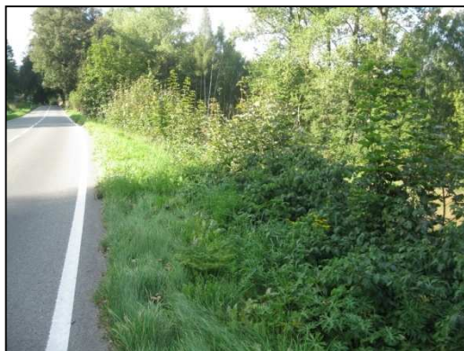
Obr. Č.46. Střední část řešeného úseku silnice