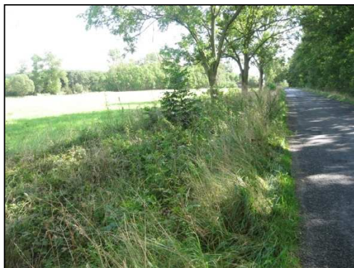
Obr. Č.22. Střední část řešeného úseku silnice