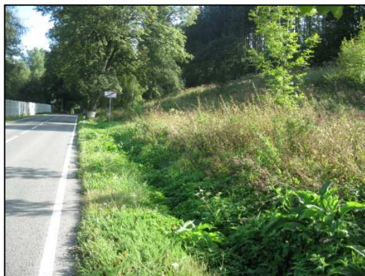
Obr.č.42. Začátek úseku na severní straně