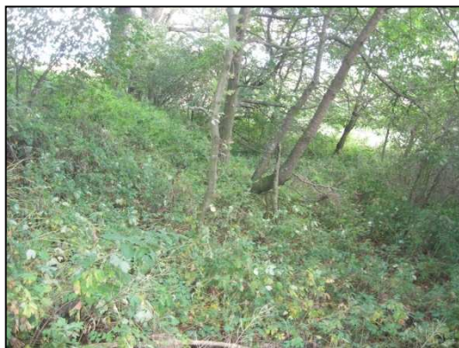
Obr. č. 32. Svah komunikace v blízkosti křížení vodního toku Bubnovka se silnicí