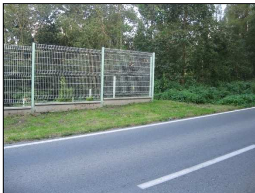
Obr. č. 48. Návrh konce bariéry ve vazbě na stávající plot