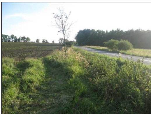
Obr.č.53. Střední úsek řešené silnice