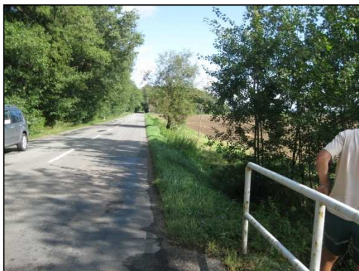
Obr.č.9. Úsek silnice mezi propustkem a západním koncem