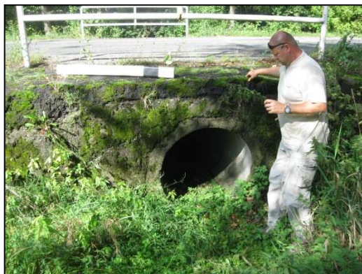
Obr.č.10. Propustek ve střední části řešeného úseku silnice