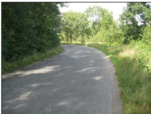
Obr.č.23. Konec úseku na východní straně