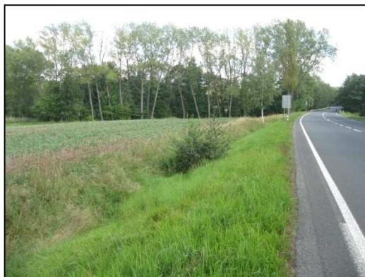
Obr.č.34. Pohled ze západní strany na rybník Čermák