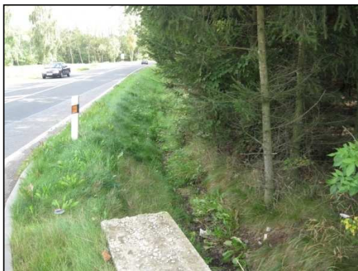
Obr.č.33. Začátek úseku na západní straně