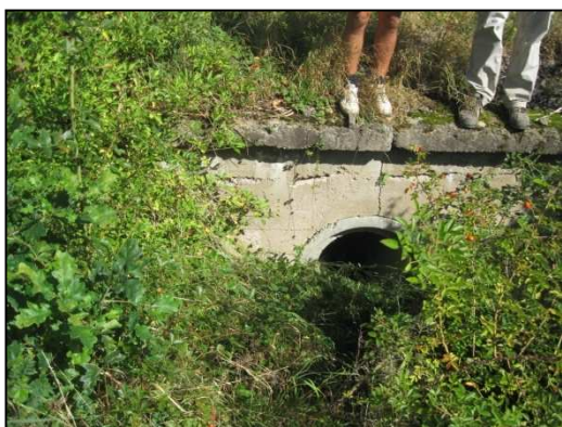
Obr.č. 19. Stávající propustek