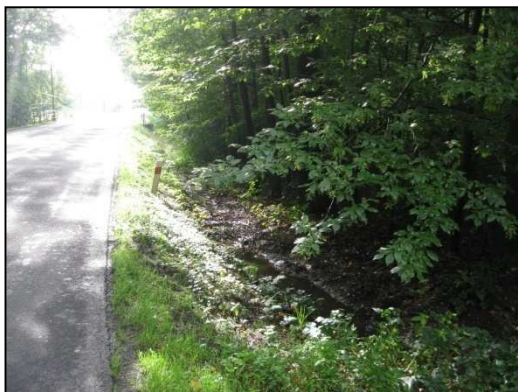
Obr.č.1. Začátek řešeného úseku komunikace na západní straně