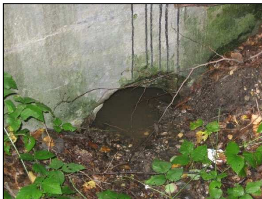
Obr.č.2. Zanesený propustek na začátku úseku