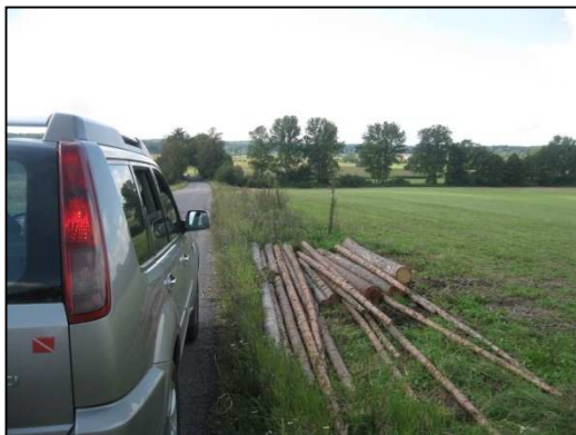
Obr.č. 27. Východní konec úseku řešené silnice