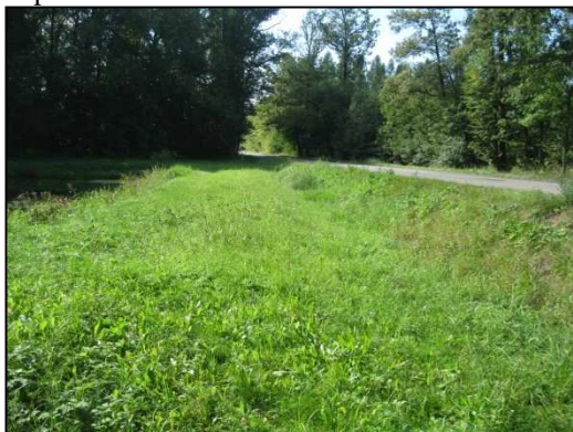
Obr.č. 11. Prostor mezi silnicí a malou vodní nádrží