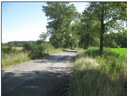
Obr.č.17. Začátek úseku na západní straně