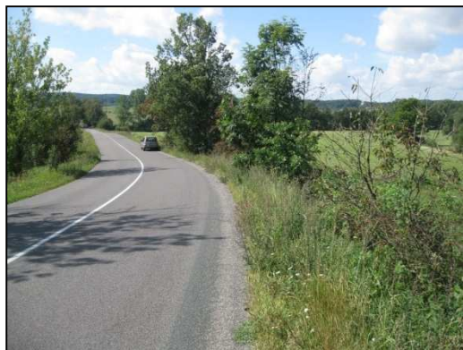
Obr.č.28. Pohled na křížení vodního toku Bubnovka se silnicí