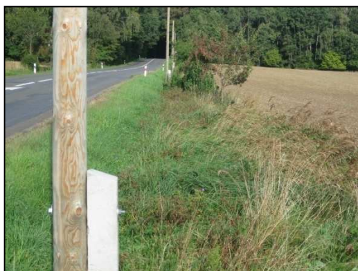
Obr.č.4. Střední část řešeného úseku silnice