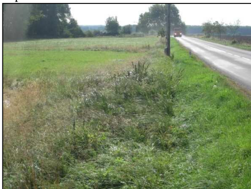
Obr.č.5. Střední část řešeného úseku silnice