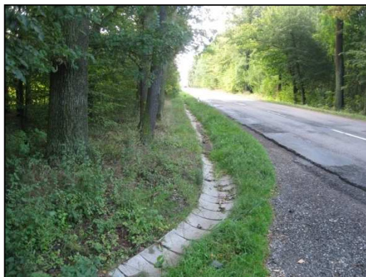
Obr. Č.14. Žlabovky nad intravilánem obce