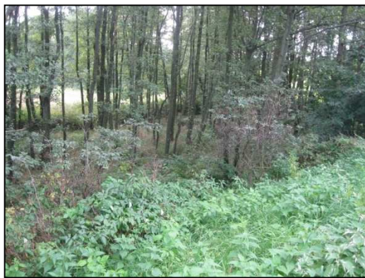
Obr. č. 40. prostor pod hrází, vhodný pro návrh tůň