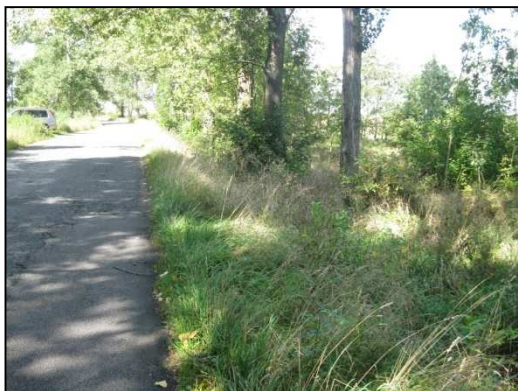
Obr.č.21. Střední část řešeného úseku silnice