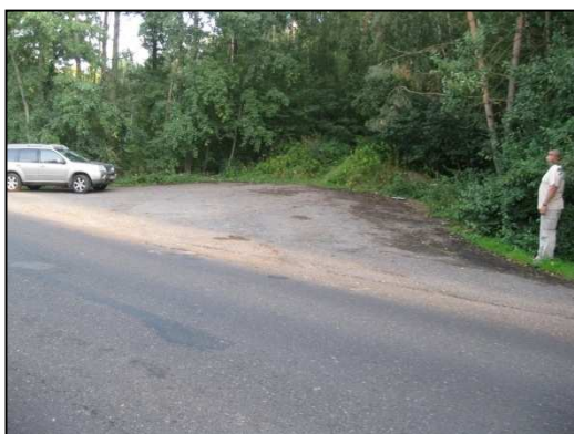
Obr.č. 59. Zpevněná asfaltová plocha ve střední části lokality