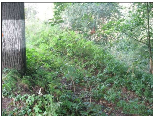
Obr.č.47. Sjezd ve středním úseku silnice