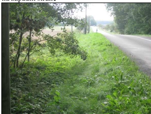
Obr.č. 3. Začátek řešeného úseku silnice na západní straně