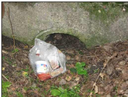
Obr.č.58. Stávající zanešený propustek na východní straně