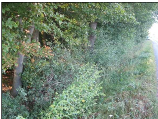
Obr.č.55. Konec úseku na jižní straně