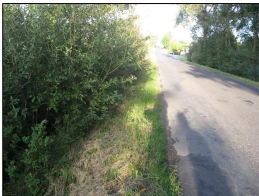
Obr.č.57. Začátek úseku na východní straně