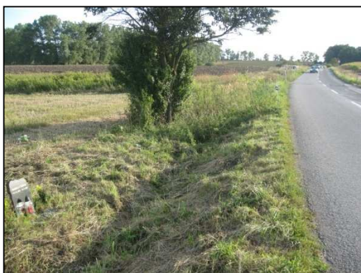
Obr.č. 51. Začátek úseku na severní straně