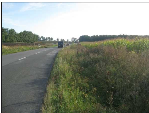
Obr.č.49. Začátek úseku na severní straně