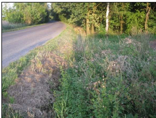
Obr.č.63. Západní část řešeného úseku silnice