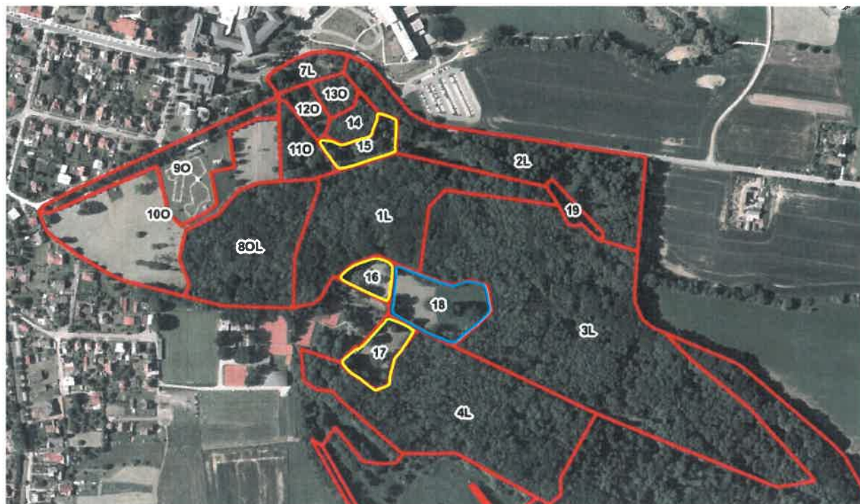
Obr. Schematické znázornění ploch určených ke kosení