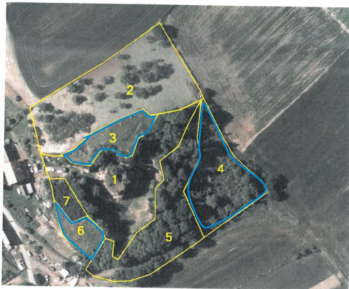
Obr. Schematické znázornění ploch určených ke kosení (sv. modře)