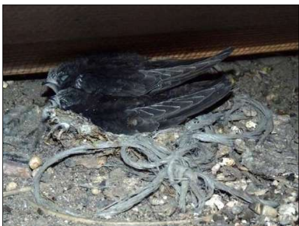
Hnízdo rorýse obecného s mláďaty