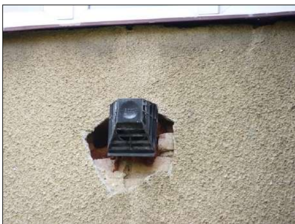
Nezačištěné okraje odvětrání podokenního topidla hnízdiště rorýse obecného