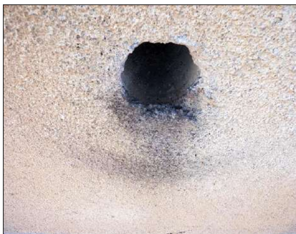
Znečištění fasády pod ventilačním otvorem, způsobené otěrem rýdovacích per pěvců