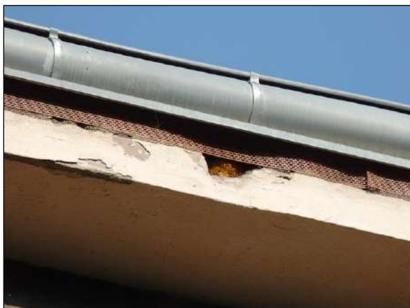
Detail poškození římsy – vletový otvor do hnízda