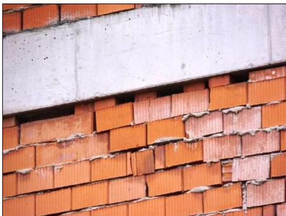
Poškození neomítnutého zdiva – obvyklý, úkryt ptáků i netopýrů