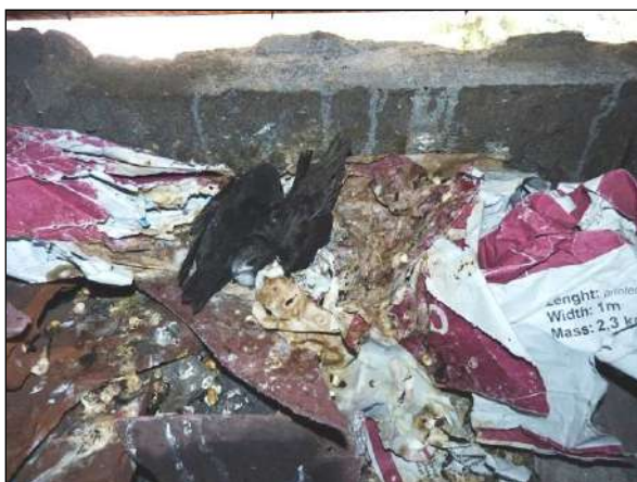
Rorýsi často hnízdo vůbec nestaví, spokojí se s materiálem, který v dutině naleznou