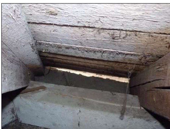
Prostor za pozednicí – nejčastější hnízdiště synantropních ptáků