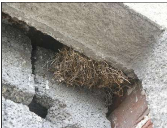
Hnízda vrabců obsahují velké množství hnízdního materiálu