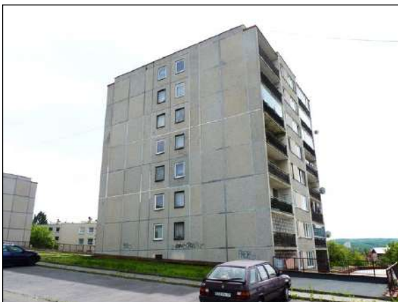
Panelový bytový dům