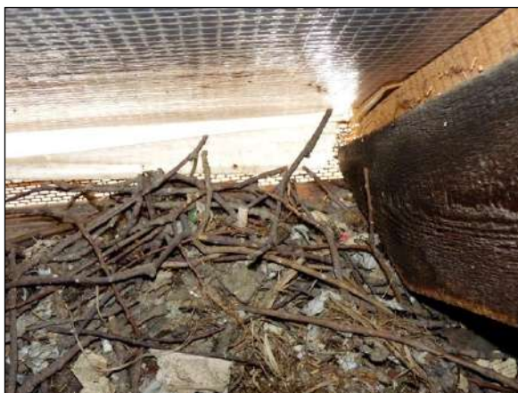
Hnízdo kavky se skládá z hrubšího materiálu, převážně větviček dřevin rostoucích v okolí