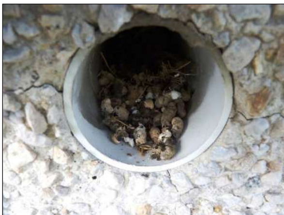
Trus rorýse obecného v ústí ventilačního otvoru