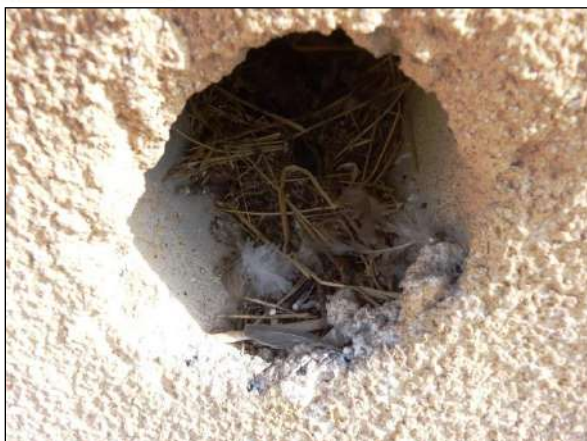
Hnízdní materiál, vypadávající z hnízda vrbců