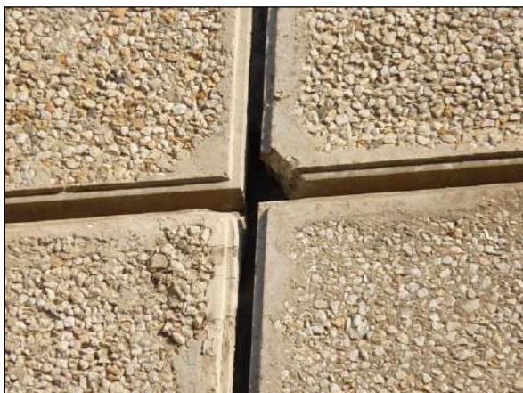
Volné spáry mezi panely