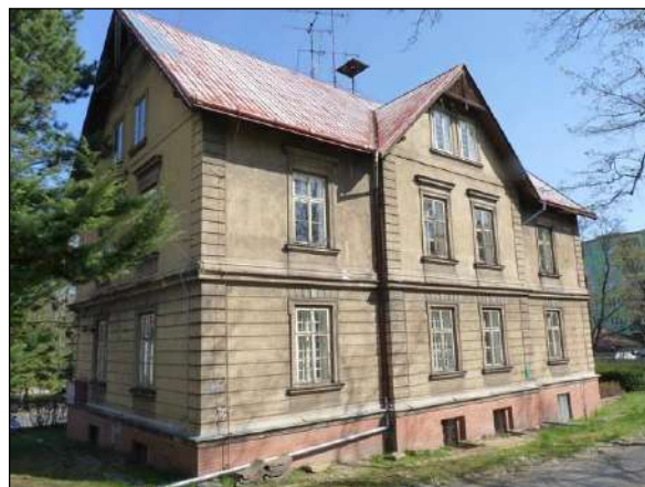
Bytový dům se sedlovou střechou