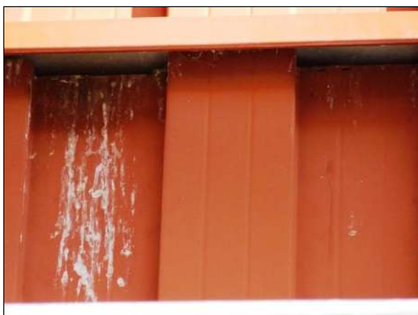
Prostor pod vletovým otvorem pěvců je často znečištěn trusem