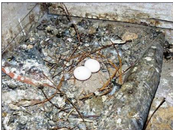
Hnízdo holuba věžáka je obvykle nedokončené