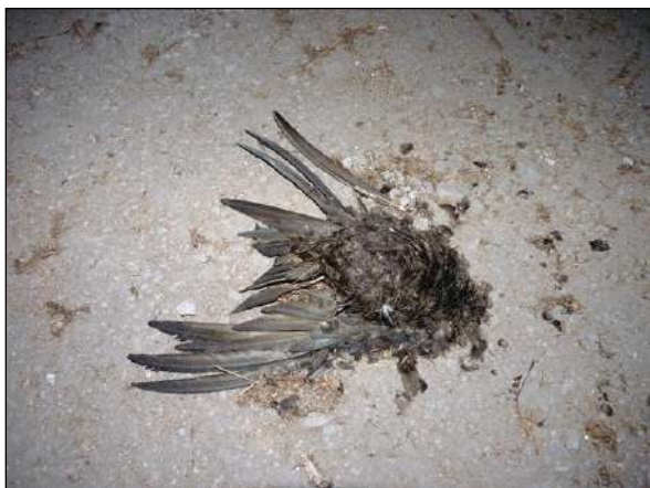
Uhynulý rorýs na podlaze půdy