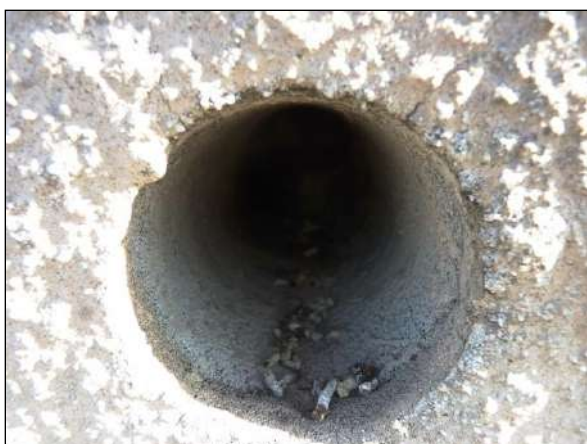
Trus drobných pěvců v ústí ventilačního otvoru