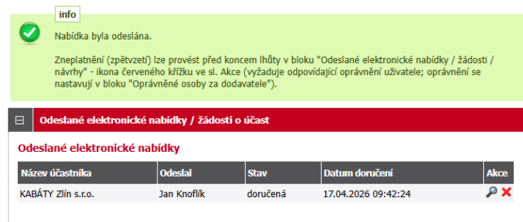
Obrázek 9: Detail veřejné zakázky po odeslání elektronické nabídky

Dodavatelé mohou po dobu, kdy je zakázka v příjmu nabídek, kdykoli svou nabídku zneplatnit a případně poslat novou. V E-ZAKu má dodavatel volbu červeného křížku v bloku Odeslané elektronické nabídky .