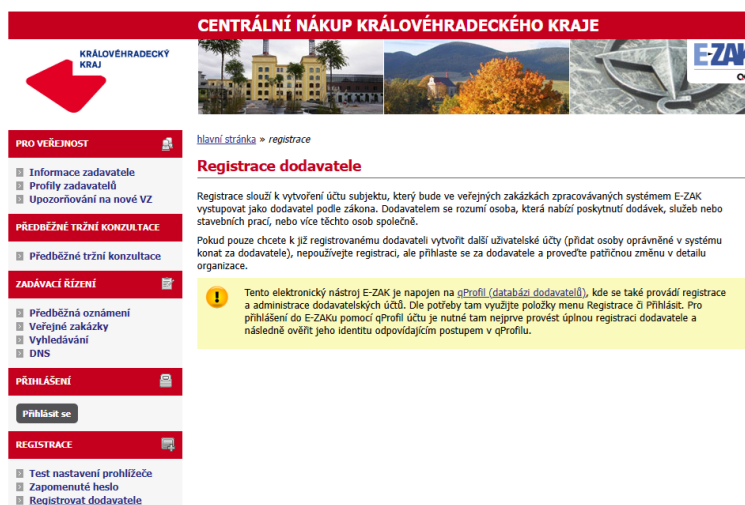
Obrázek 2: Registrace v E-ZAKu napojeným na qProfil

Pro získání možnosti přihlášení do většiny systémů E-ZAK je zapotřebí se registrovat do Centrálního účtu databáze dodavatelů qProfil .