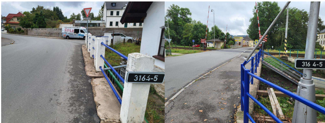
pohled po směru staničení