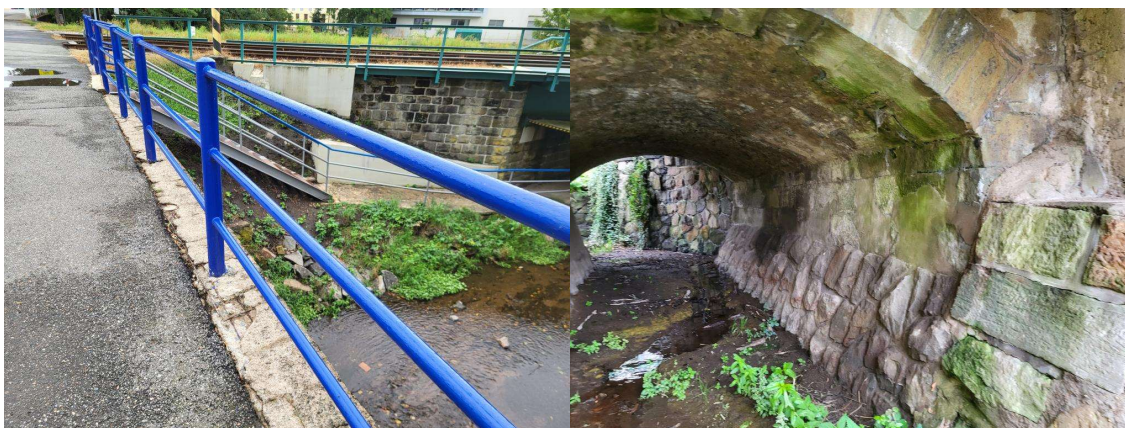
zábradlí a římsa_povodní strana