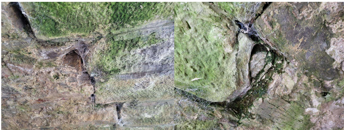
poruchy zdiva klenby_povodní strana_mostní pole č. 1 DTTO