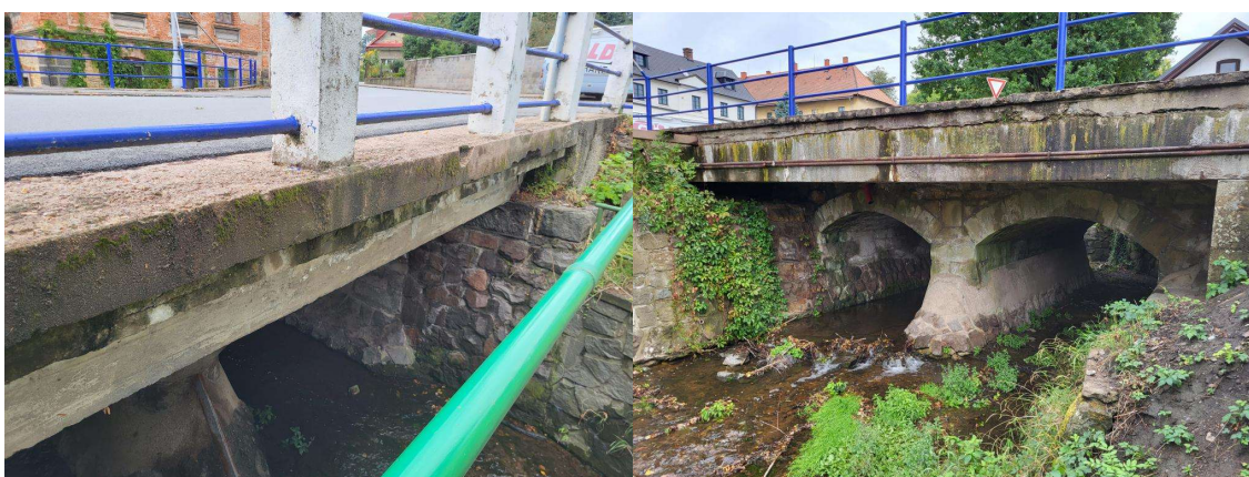
boční pohled návodní strana