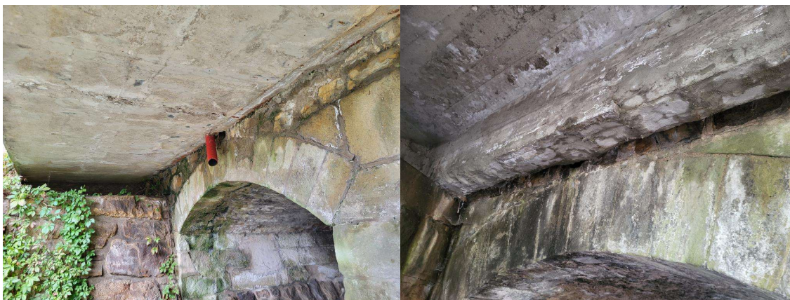
rozšíření NK_povodní strana