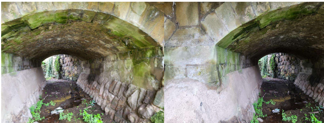
mostní pole č. 1