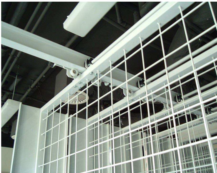
Posun rámu v konstrukci