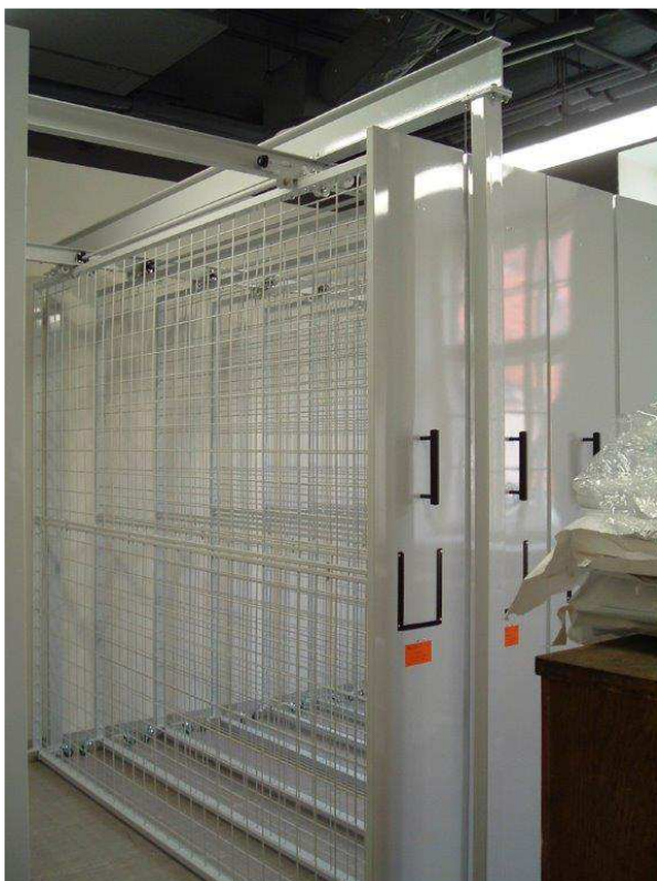
Mobilní vertikální síť pro zavěšení obrazů