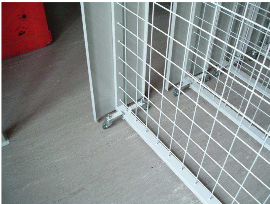
Posun rámu po DTD podlaze