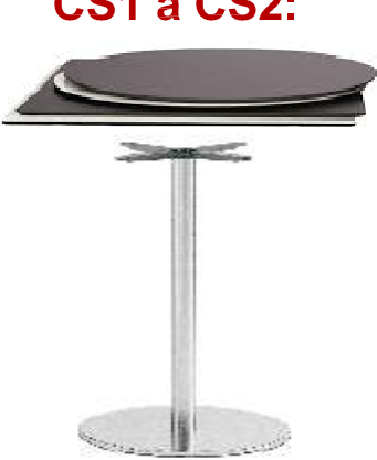
CS1 a CS2:

stolový podstavec, materiál: leštěná nerezová ocel, stolová deska kompakt, 600x600 mm nebo průměr 600 mm barva: bílá včetně jádra