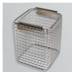
Standardní koš pro kazety Cat. No. 11-1552-00