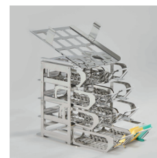
Koš se 4 x 2 vložkami Cat. No. 11-1553-00