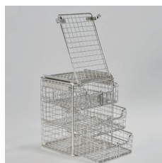
Koš se 3 vložkami Cat. No. 11-1560-00