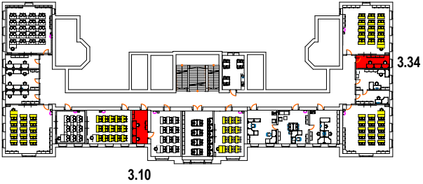
kabinet 3.10, 3.34