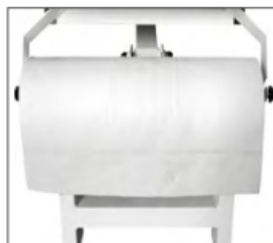
Držák na papír