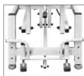
Jízdní kola - zvedaná