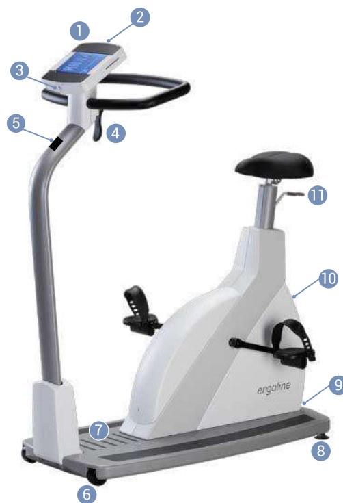
Obr. 4–2: ergoselect 5T