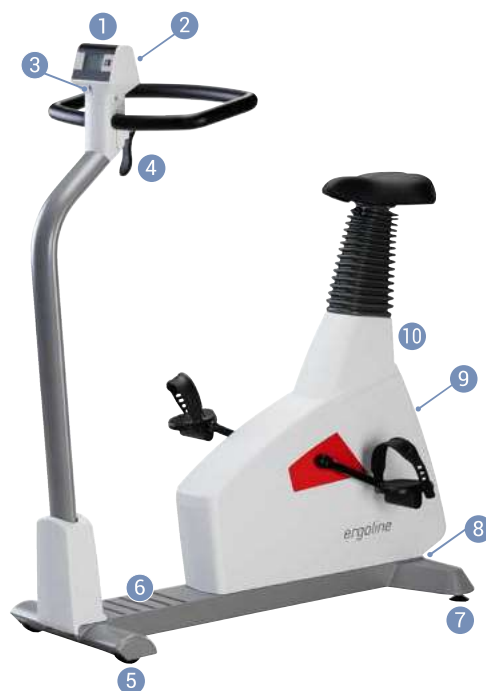
Obr. 4–1: ergoselect 4M