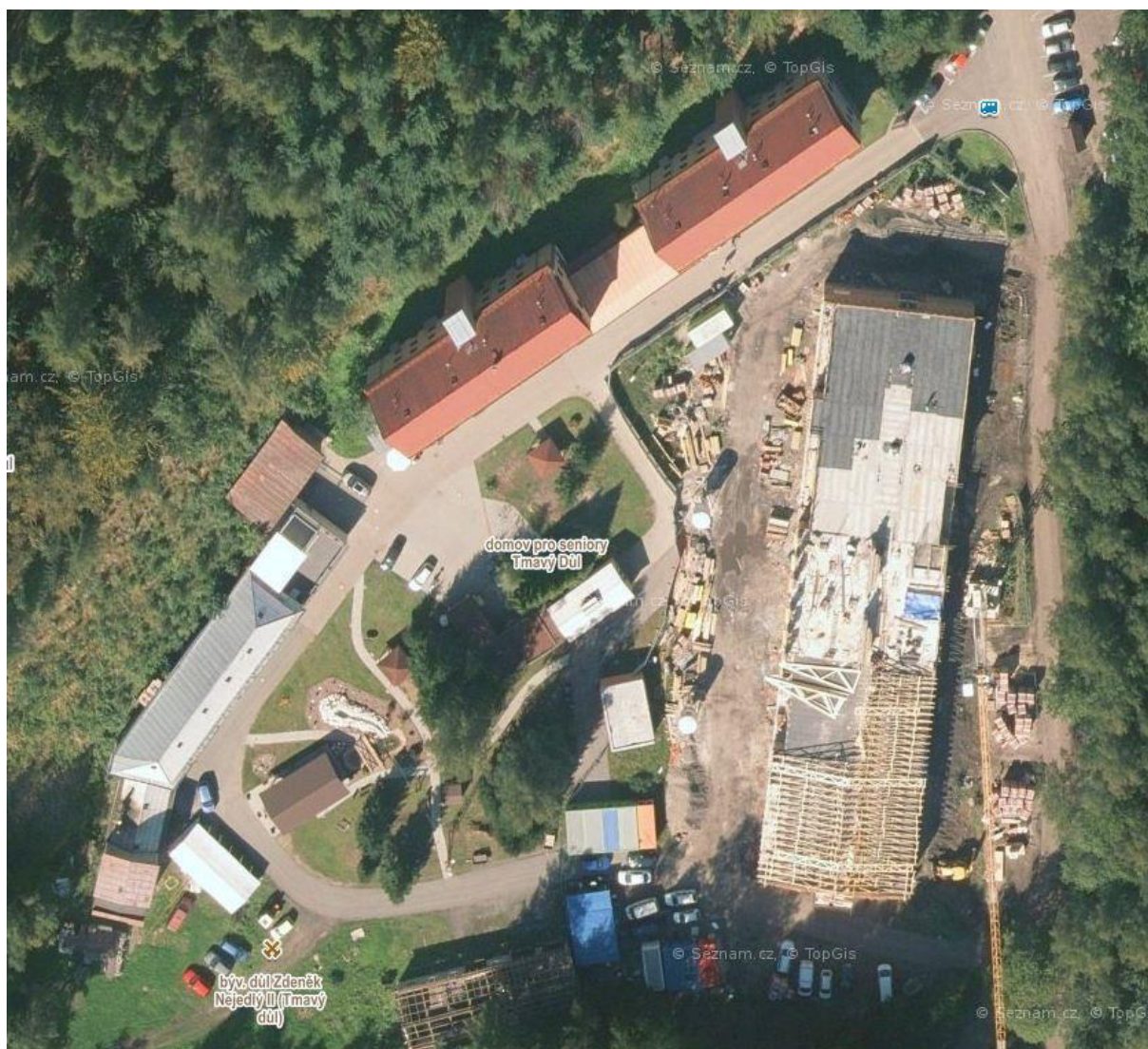
Obr. č. 2 Domov sociální péče Tmavý Důl