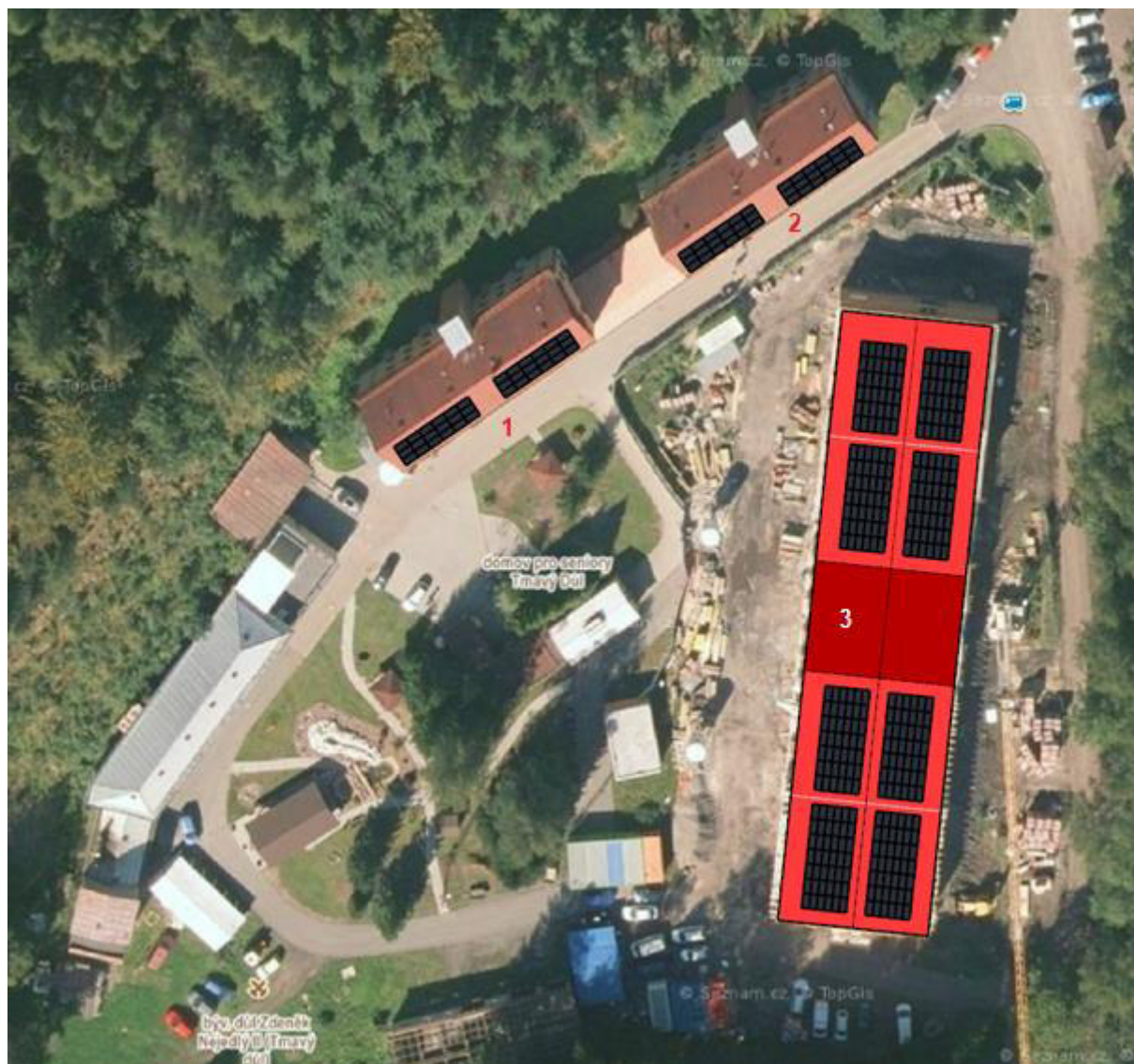
Obr. č. 3 Předpokládané rozmístění panelů na střechách