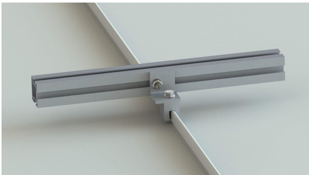
Obr. č. 6 Možné uchycení roznášecí konstrukce na střešní krytinu objektu