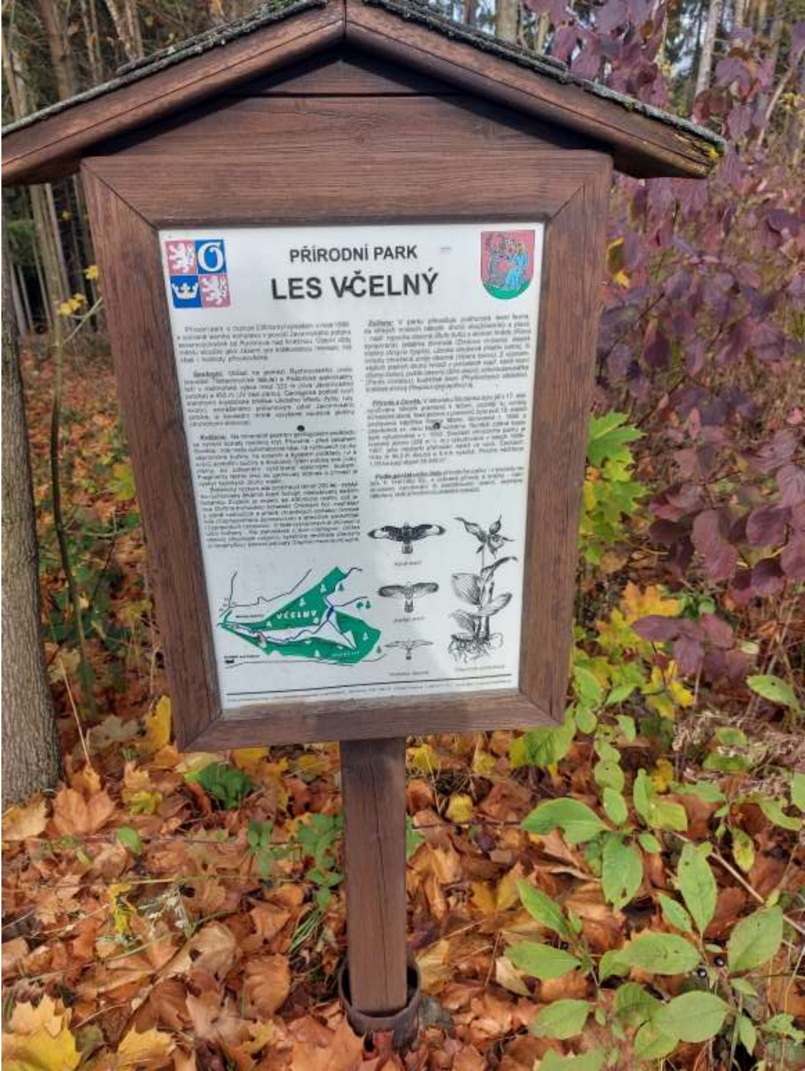
Fotografie stávající tabule: