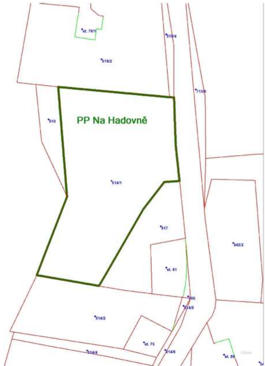
Příloha 2: Katastrální mapa s vyznačeným zvláště chráněným územím PP Na Hadovně