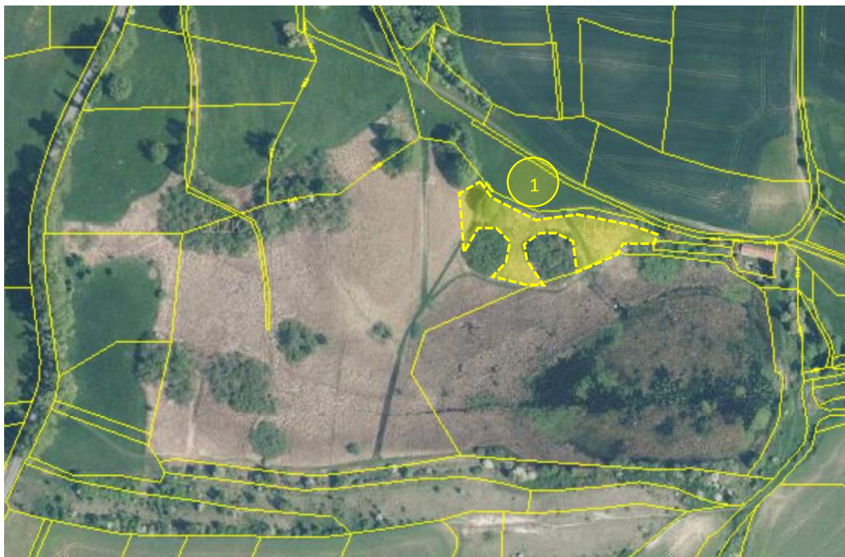
Obr. 3 Schematické znázornění zájmové plochy určené ke kosení travních porostů včetně odstranění výmladků dřevin, vyhrabání a odvoz biomasy na části pozemku p. č. 827 v k. ú. Ostružno u Jičína (žlutě)