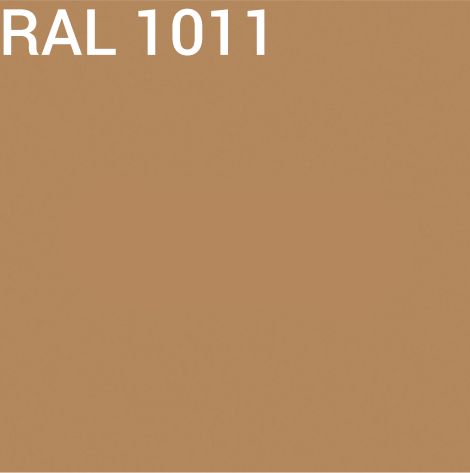
detaily na objektech

(velkoformátová rektifikovaná dlažba s jemnou cementovou texturou - RAL 7044 - teplá šedá)