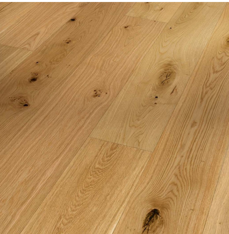
třívrstvá dřevěná podlaha

(drásaný dub se středně výraznou kresbou)