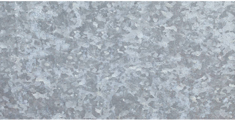
kovové prvky v exteriéru a na střechách

(nástřík v doplňkové barvě, dle konkrétního objektu)