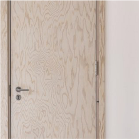
dveře a rámy oken

(drásaný dub se středně výraznou kresbou)