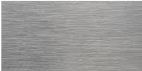
kovové prvky v interiéru